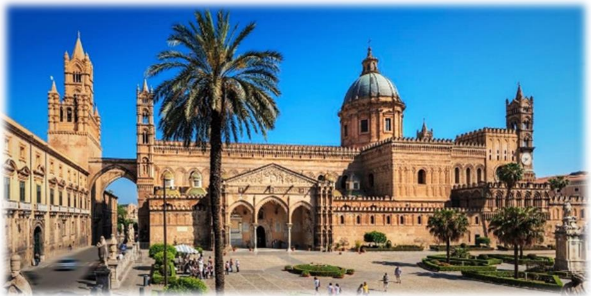
La Cathédrale de Palermo.