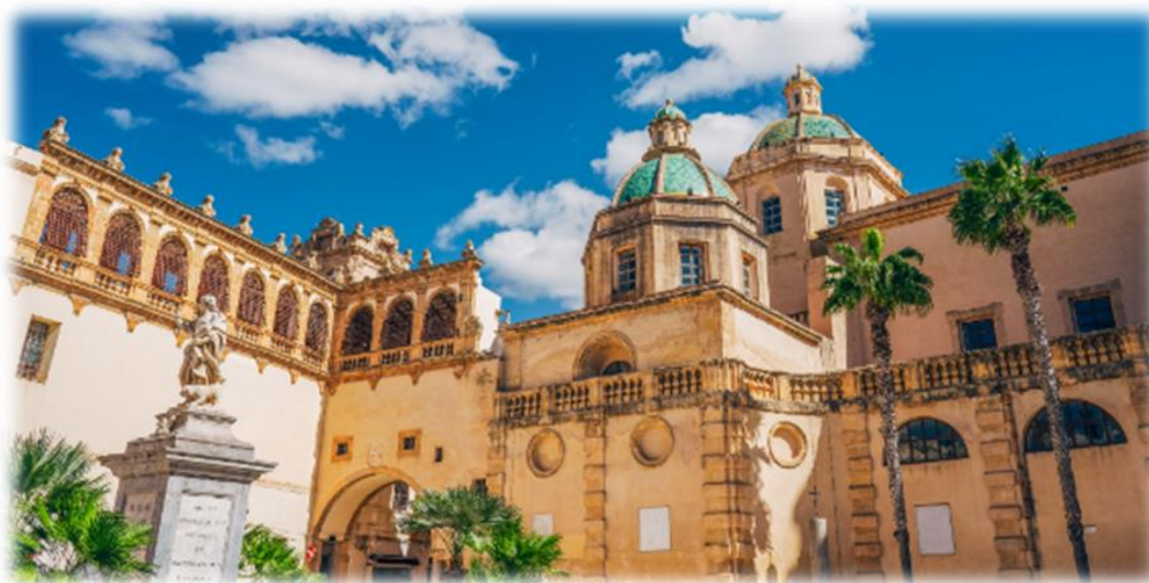
Mazara del Vallo