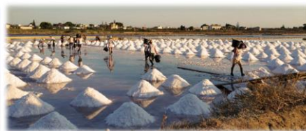
Salines de Trapani