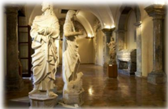
Musée Pepoli Trapani