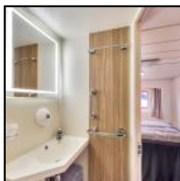
Cabine Arctique Supérieure Cat. P

- Cabine Polar Extérieur - catégorie N (5 cabines) : cabines extérieures situées sur les ponts intermédiaires et disposant d'une salle de bains avec douche et WC. Elles ont vue sur mer et disposent de lits séparés dont l'un peut se transformer en sofa.