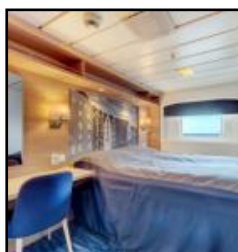
Cabine Arctique Supérieure Cat. U