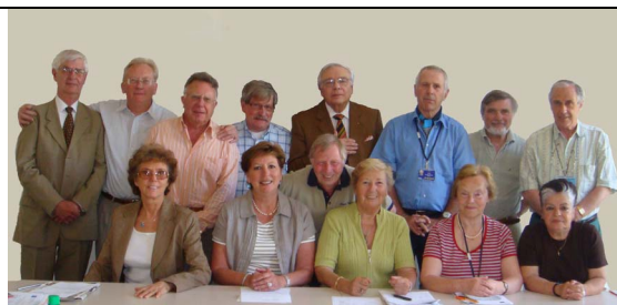
Le Conseil d'administration

Le Président est présent le lundi après-midi et le jeudi matin